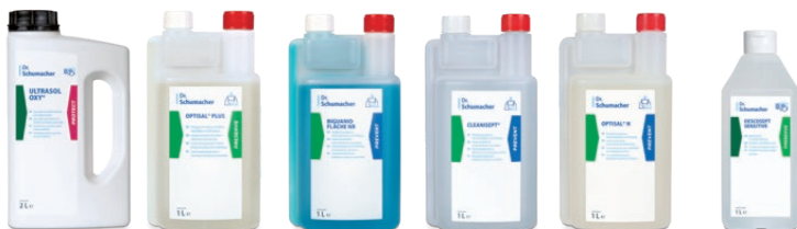
ULTRASOL OXY® OPTISAL® PLUS BIGUANID FLÄCHE NR CLEANISEPT® OPTISAL® N DESCOSEPT SENSITIVE

ULTRASOL OXY // OPTISAL PLUS // BIGUANID FLÄCHE NR // CLEANISEPT // OPTISAL N // DESCOSEPT SENSITIVE