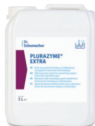
5 L Kanister