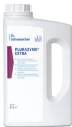
2 L Flasche