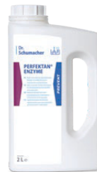
PERFEKTAN ENZYME 2 L