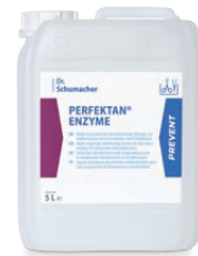
PERFEKTAN ENZYME 5 L